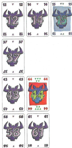
Fig. 2 : les 4 séries après le 1 er tour.

On répète le même processus jusqu'à ce que les 10 cartes des joueurs soient épuisées.