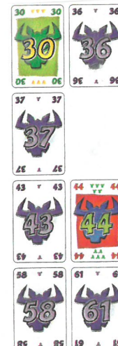
Fig. 3 : les 4 séries après le 2 e tour.

Le «21» et le «26» vont dans la 1 re série, qui compte maintenant 5 cartes et qui est donc terminée. Le joueur qui a joué le «30» doit lui aussi déposer sa carte dans la 1 re série. Mais, comme il s'agit de la 6 e carte, il doit ramasser les 5 cartes de la série. Son «30» est maintenant la 1 re carte de la 1 re série. Le «36» doit également être joué dans la 1 re série. Il vient après le «30».